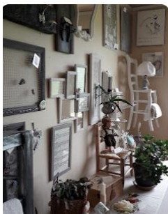
Recyclerie à Grumesnil ouverte Le samedi, 18 km