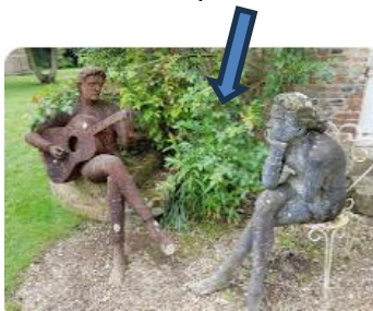
Jardin des sculptures à Bois Guilbert, 15km